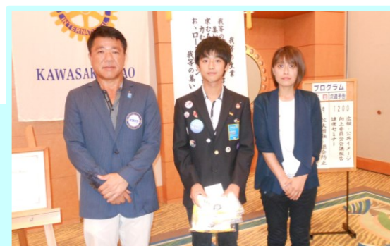
左より森会長、竹尾光君、お母様