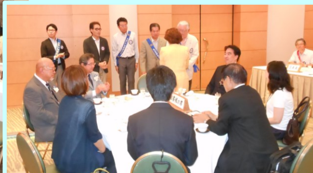
ようこそお出でくださいました