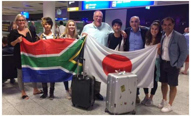
フランクフルト空港に多くの方が迎えに来てくださいました。

2 人が帰ってからはホストファミリーにフランクフルトの中心部に連れていってもらいました。初めてのドイツでの電車では日本の新幹線のような向かい合って椅子が並んでいることに驚き、キップの買い方の違いにも驚きました。またフランクフルトを歩いているとアジア系の観光客も多くいました。その日は駅の中心でパーティが開かれており、多くの人がり