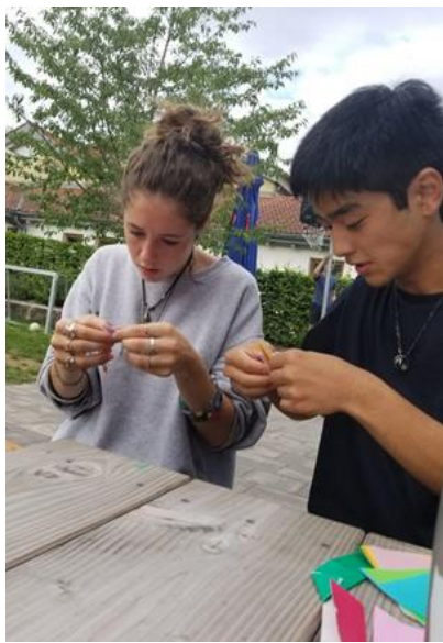
折り紙を教えました

語の勉強だけでなくチョコレート工場やビール工房などの見学、体験もさせていただきました。チョコレート工場ではチョコレートを作ることができ、とても良い体験ができました。またビールはドイツの文化なのでビールを学ぶ事が出来て良かったと感じています。こうして、苦しくて楽しい二週間のランゲージキャンプを終える最終日にはそれぞれの国でそれぞれの国についての発表をドイツ語ですするというものがありました。そこまで長くはありませんでしたが、私にとっては難しく緊張するものでした。本番は何とか発表することができ、安堵しました。