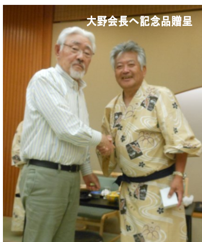
大野会長へ記念品贈呈