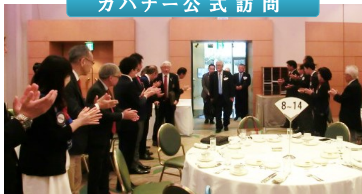
拍手でガバナーをお出迎え