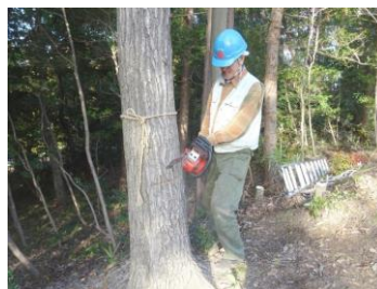
伐採(11 月から伐採開始)