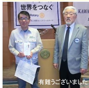
有難うございました