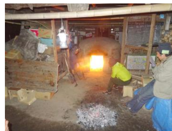
点火(1 月から炭焼き実施)