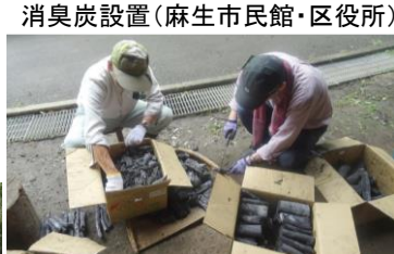
消臭炭設置(麻生市民館・区役所)