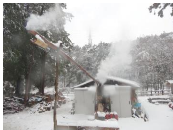
煙(雪にも負けず三日目)