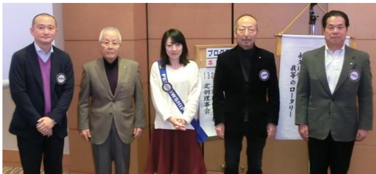
2月に記念日を迎えた会員