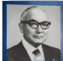
1982年 国際ロータリー会長に 向笠廣次が就任