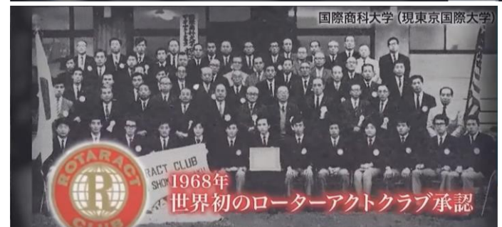
国際商科大学 (現東京国際大学)