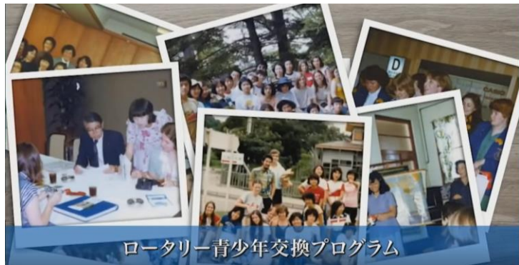
ロータリー青少年交換プログラム