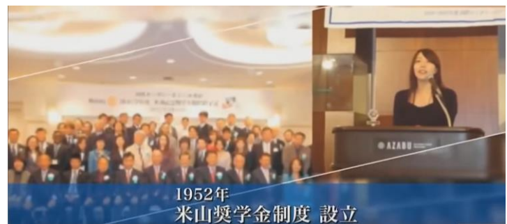
1952年 米山奨学金制度 設立