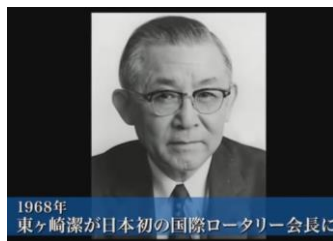
1968年 東ヶ崎潔が日本初の国際ロータリー会長に