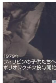
1979年 フィリピンの子供たちへ ポリオワクチン投与開始