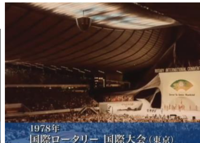
1978年 国際ロータリー 国際大会 (東京)