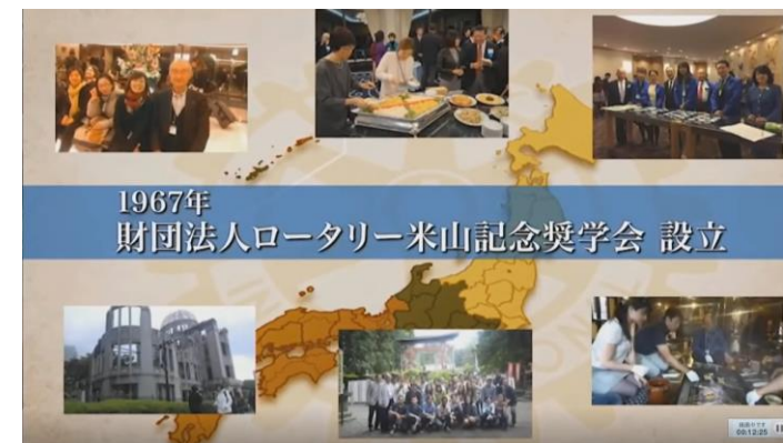
1967年 財団法人ロータリー米山記念奨学会 設立