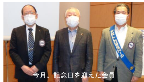
今月、記念日を迎えた会員