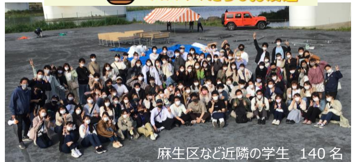
麻生区など近隣の学生 140 名