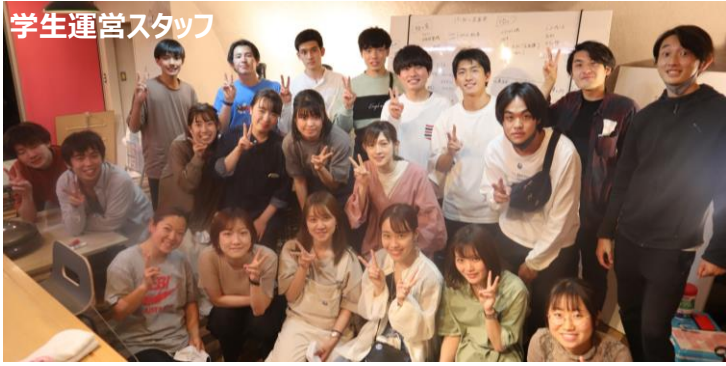
学生運営スタッフ

本日は有難うございました。30周年記念5年間継続事業の第2回目として、寄付目録をお渡しいたします。