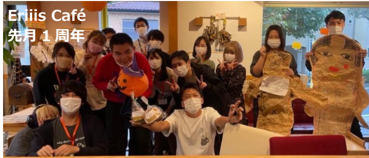
Eriis Café 先月1周年