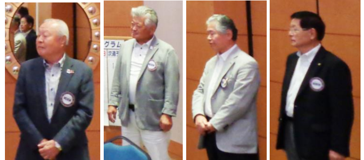
今月、記念日を迎える会員