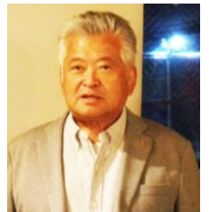
写真: 志村幸男 委員