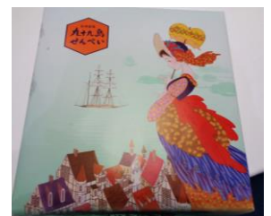
大村東 RC 為永様よりのお土産