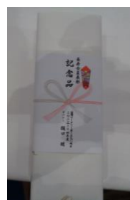
地区大会 長寿記念品