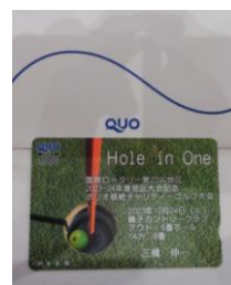
地区大会 ゴルフ記念品