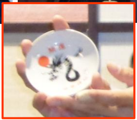
琴平神社(志村会員)の 今年の絵皿