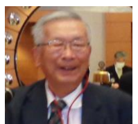
写真:志村幸男 委員