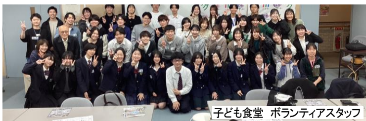
子ども食堂 ボランティアスタッフ