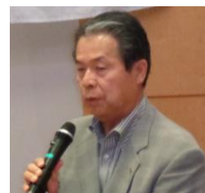
写真:鈴木豊成 委員