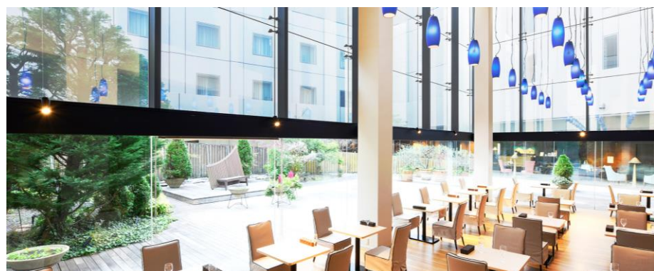
ひだまりのレストラン Le Ciel Molino ル シェル モリノ