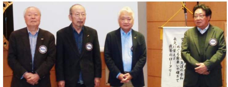
今月、記念日を迎える会員